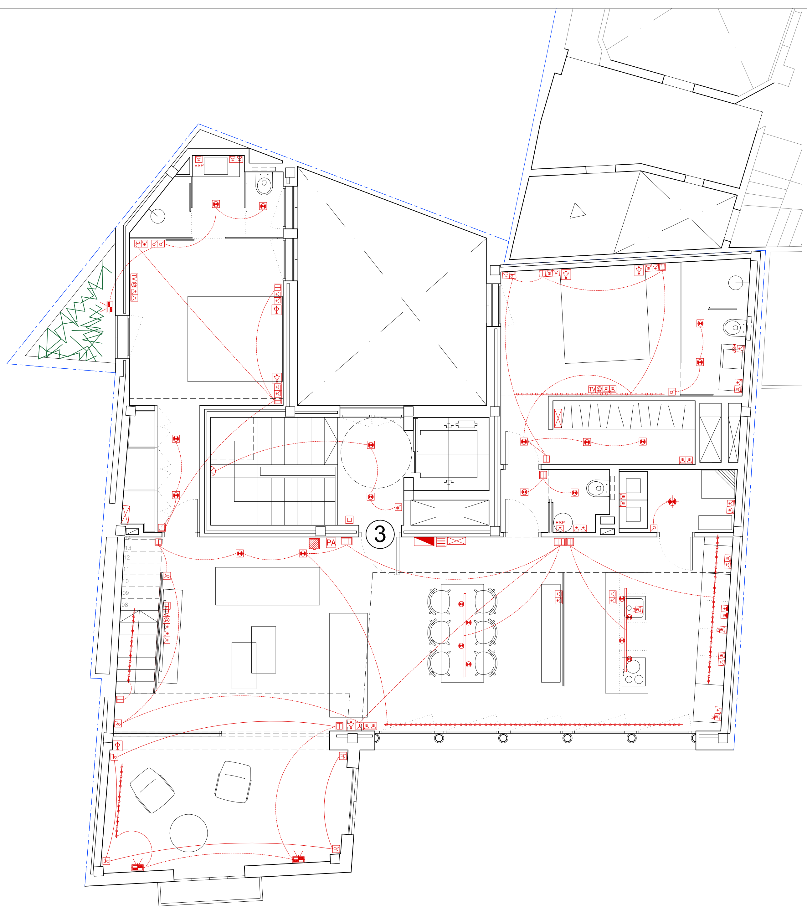
EDIFICIO 1_PLANTA PISO 3